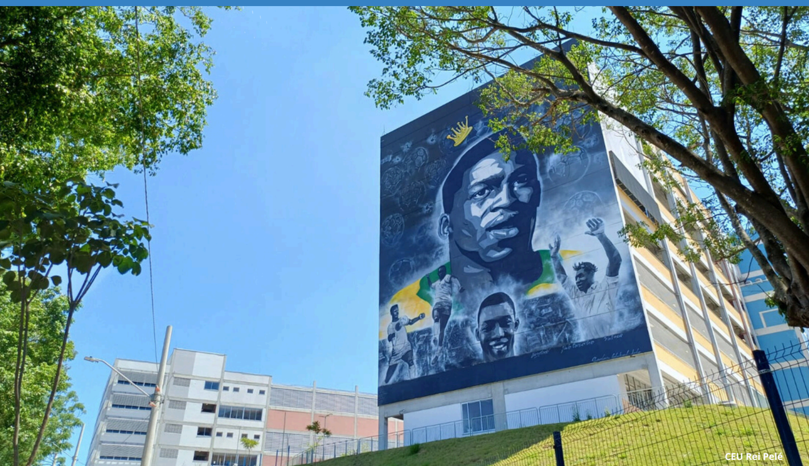
CEU Rei Pelé